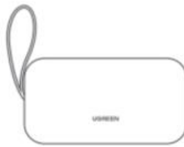
1 × Accessories Storage Bag