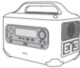
1 × 600W PowerRoam Power Station