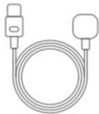
1 × AC Power Cable