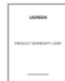
1 × Warranty Card