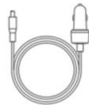
1 × Car Charging Cable