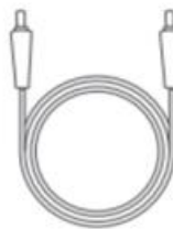
1 × DC5521 to DC5525 Cable